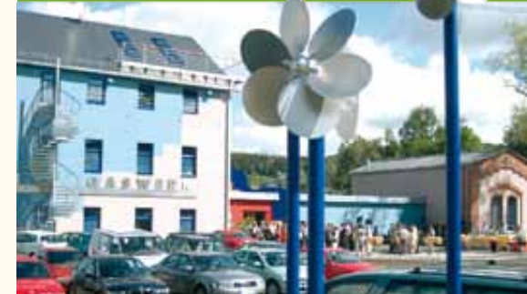
Windspiel an den Stadtwerken

Interessante Einblicke in die Lebensweise, die Geschichte und das Brauchtum der Olbernhauer können Sie im Museum am Markt erhalten. Ein Museum für die ganze Familie.