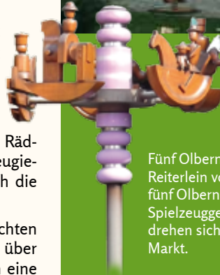
Fünf Olbernhauer Reiterlein von fünf Olbernhauer Spielzeuggestaltern drehen sich am Markt.