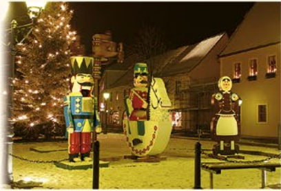
Olbernhauer Markt in der Adventszeit